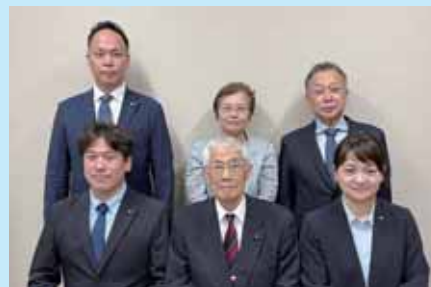
議会広聴広報委員