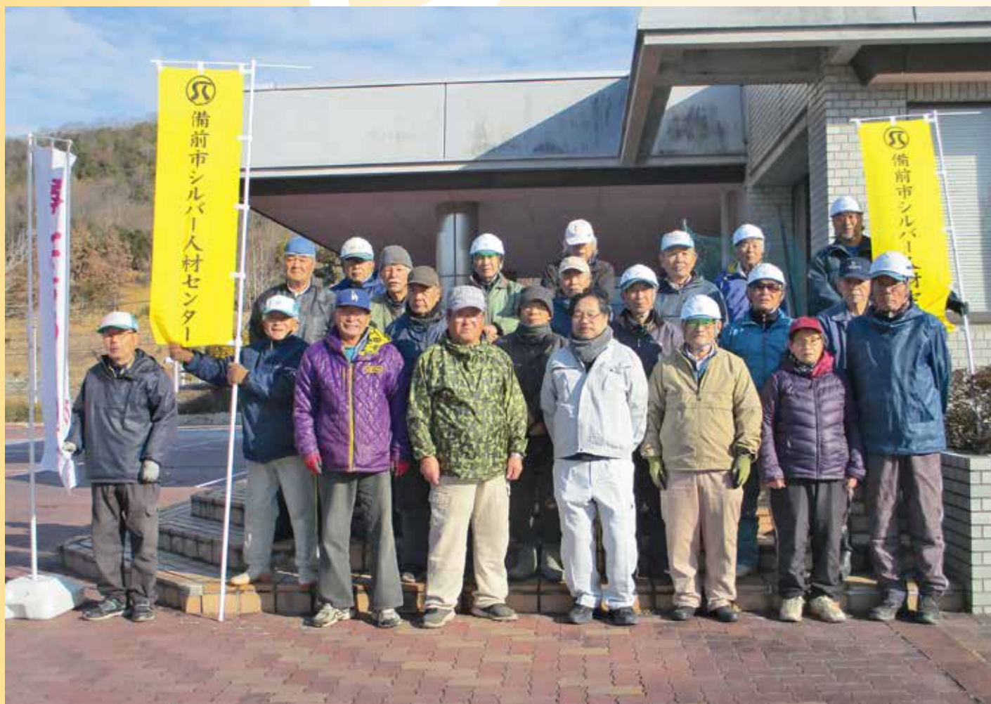
ボランティア活動 in 備前市チオビタ運動公園