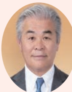
山本 雅彦 議員