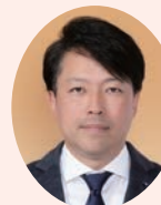
河野 慶治 議員

〒700-8570 岡山市北区内山下2-4-6 https://www.pref.okayama.jp/site/gikai/