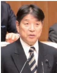
えもと きみかず 江本 公一 議員 [自由民主党]