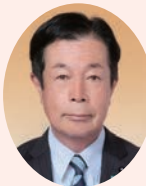
渡辺 英気 議員