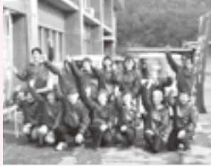
三石いきいき付添サポート隊