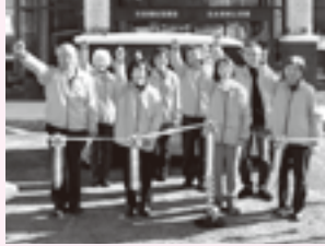
吉永付添サポート隊