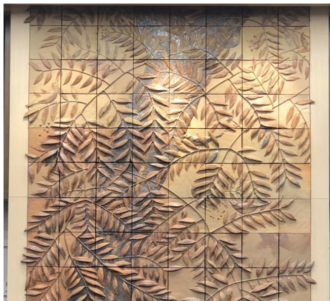
議場正面の備前焼レリーフ