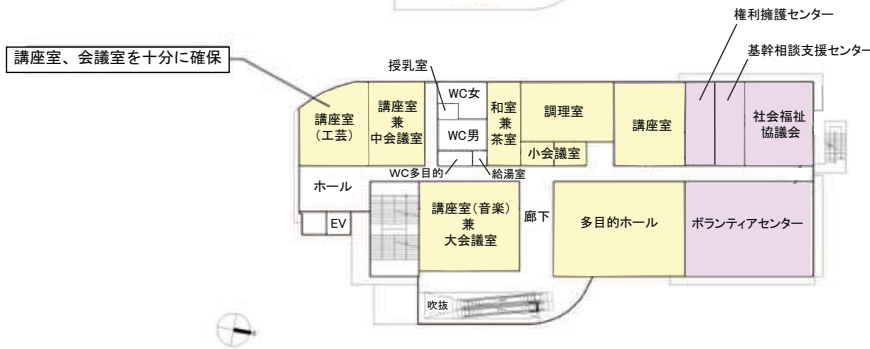
(案) 2階 平面計画