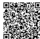
申し込みはこちら

◆申問 総務課職員係 (☎64-1808 ☎705-8602 備前市東片上126)