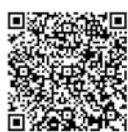
出前スポーツ教室