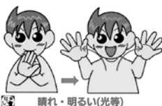
晴れ・明るい(光等)

天気が良いと、気持ちはずみずみですね。水分補給をしながら、のんびり散歩も良いですね。【晴れ】顔の前で広げた両手を左右に開く