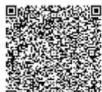
備前サンラッキーズホームページ

今年度より全日本女子野球連盟に加盟し、各種大会に出場します。今年度開幕する中四国女子硬式野球連盟主催の「ルビー・リーグ」にも参加します。公式試合等の情報は、備前サンラッキーズホームページをご覧ください。ご声援よろしく願います。