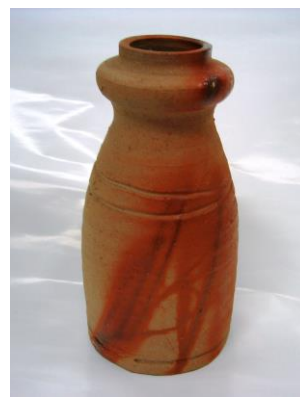
備前 ～炎～ 伝統の備前焼