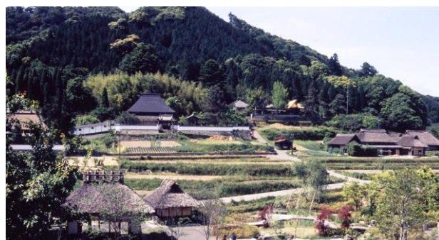
吉永 ～山～ 八塔寺ふるさと村