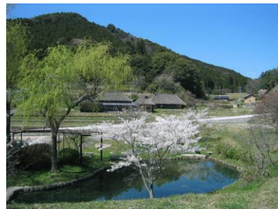
特別史跡 旧閑谷学校 (H27.4 日本遺産認定)