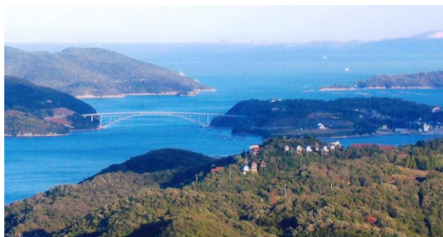
日生 ～海～ 諸島を望む