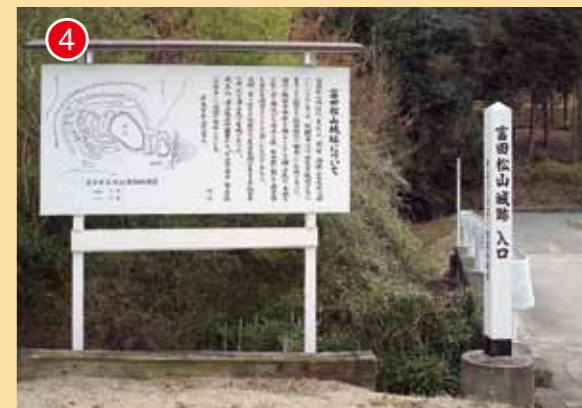
富田松山城跡登山口