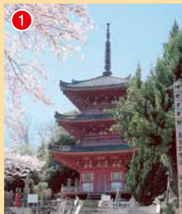
国指定重要文化財 真光寺 三重塔