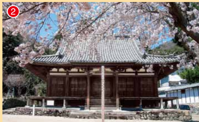
国指定重要文化財 真光寺 本堂