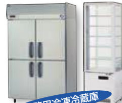
業務用冷凍冷蔵庫