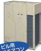
ビル用 マルチエアコン