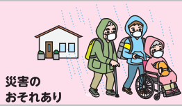
災害の おそれあり