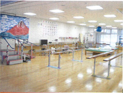
機能回復訓練室 (リハビリ)