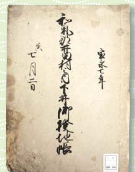
備前国和气郡井田村 延原家文書